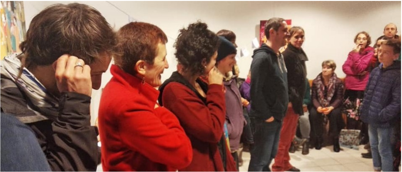
BH - Monts du Lyonnais (69)

Chaque “bibliothèque humaine” est souvent un moyen de rebond vers la création d’un nouveau cycle de prises de parole, les personnes ayant écouté, marquées par les récits entendus, ayant très souvent l’envie de se raconter à leur tour.